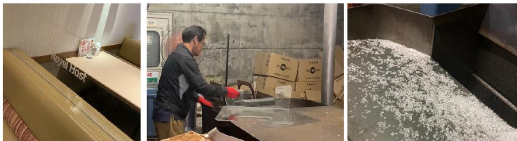
左：店舗で使用される亚克力板／中央：亚克力板を破砕機に挿入する様子／右：破砕されたプラスチック片

ロイヤルグループは、外食事業等を核に全国に店舗展開し、これまでも食品ロス削減をはじめ、環境対策に積極的に取り組まれてきました。その中で、さらなる環境負荷低減に向けて、 店舗で使用された亚克力板の再資源化 を開始。これによる CO2 排出削減は 15 トン にのぼり、杉の木 1,700 本が 1 年間に吸収する CO2 量に相当する成果を得ました。